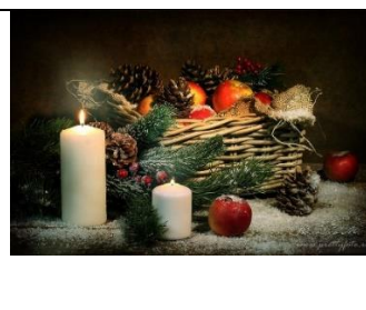
А) Новый год